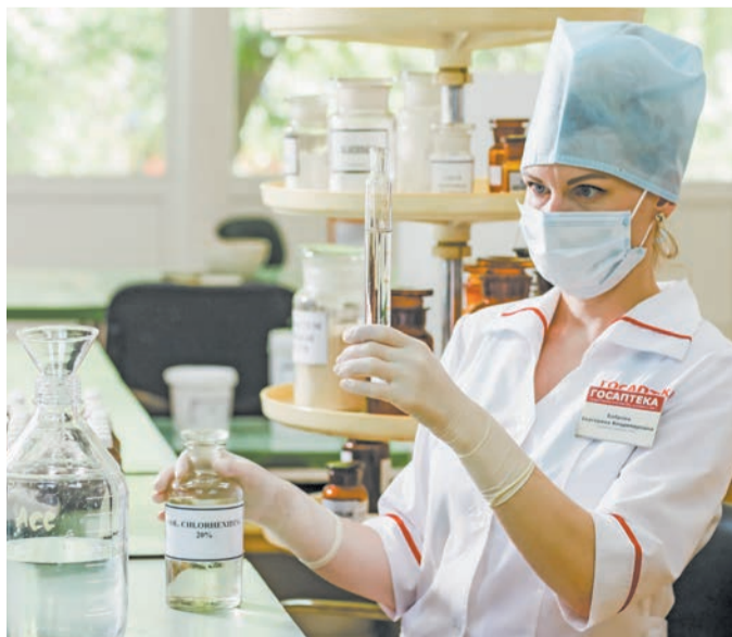
Рецептурно-производственный отдел «Госаптеки».

В 2020 году ГУП «Башфармация» РБ запустила собственный сервис по поиску и заказу лекарственных средств, товаров для красоты и здоровья, интернет-аптеку bash-apteka.ru . Данный сервис позволяет купить необходимые лекарственные средства намного дешевле, чем в розничной сети, и существенно экономит деньги и время.