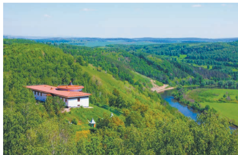
↑ Паровоздушную лечебницу санатория, расположенную на вершине горы Янгантау, видно издалека.