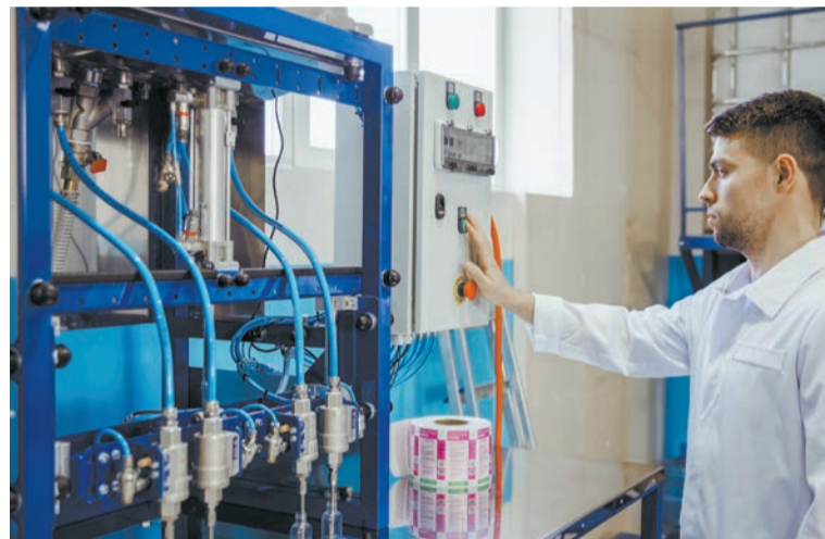
⬆ Вся продукция компании «Дэлекса» производится на современном оборудовании.