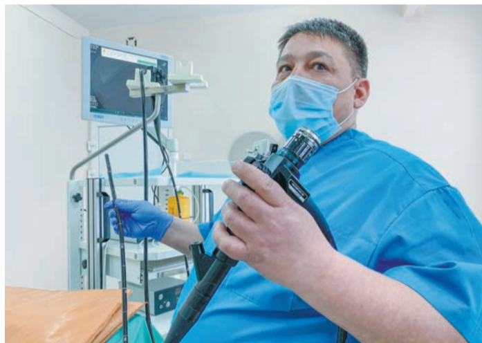
В городской больнице Нефтекамска используют самое современное оборудование.

Филиал колледжа расположится в административном крыле лечебного корпуса №1 городской больницы Нефтекамска. Теоретическую подготовку будет вести преподавательский состав медицинского колледжа, а вот практические занятия — действующие врачи. Кстати, нефтекамские эскулапы также преподают в медицинских классах школ города, чтобы ребята заинтересовались профессией как можно раньше.