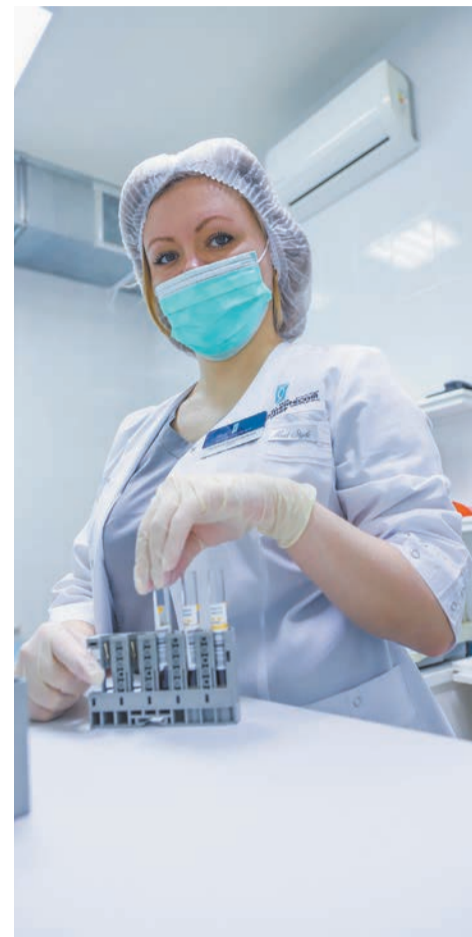
↑ РМГЦ в числе лидеров среди медучреждений страны по профилактике врожденных пороков у детей.