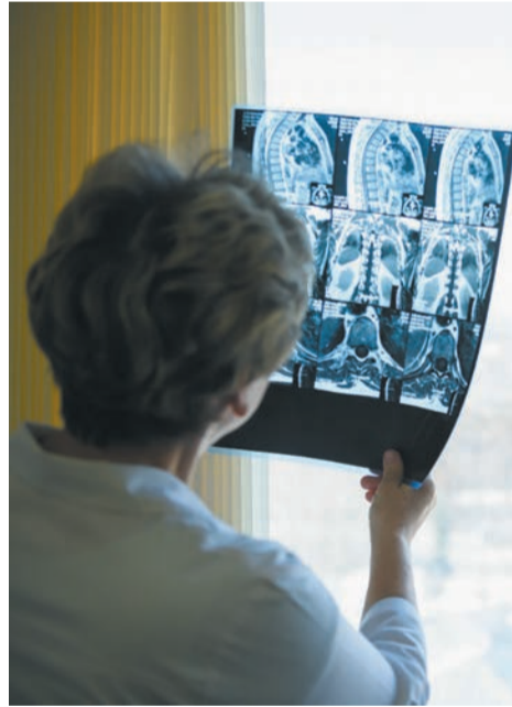
⬆ Современные методы диагностики и лечения доступны пациентам больницы №13.

Амбулаторно-поликлиническое звено мощностью почти 3000 посещений в