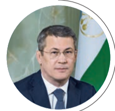
РАДИЙ ХАБИРОВ, глава Республики Башкортостан

— Наши врачи и медсестры в очередной раз доказали, что они — мужественные люди, которые выполняют свой врачебный долг в самых сложных условиях и являются примером для подражания.