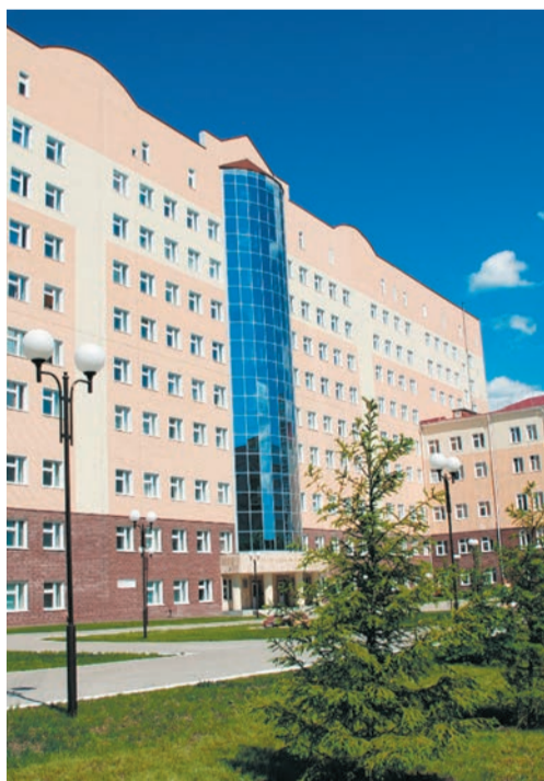
Ⓜ РКБ им. Г. Г. Куватова — признанный флагман отрасли.

• Адрес: 450005, Республика Башкортостан, г. Уфа, ул. Достоевского, 132