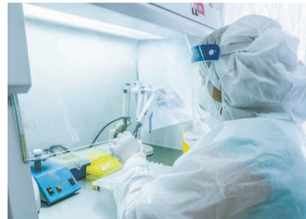
Ⓢ Специалисты РКИБ с одного взгляда могут определить опасных возбудителей болезней.

нужно помочь разобраться с проблемами здоровья