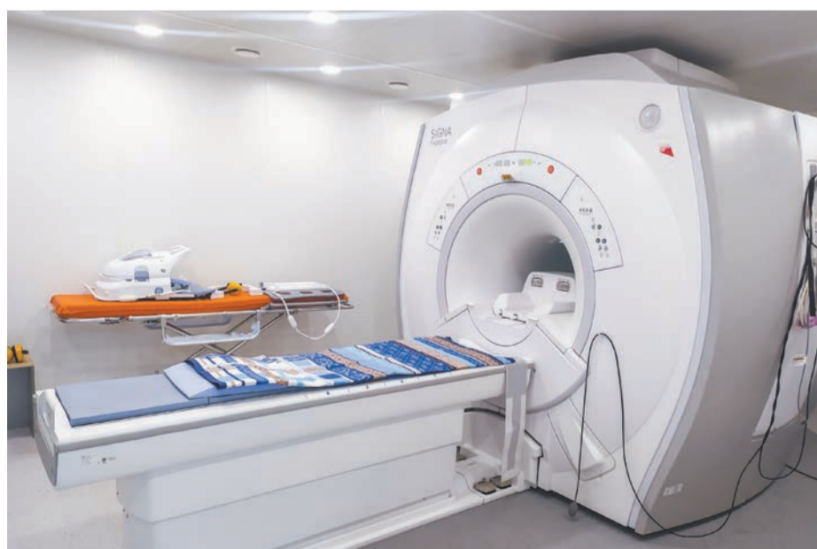
Ⓢ Благодаря новому томографу проводят исследования на современном уровне.

Благодаря реализации нацпроектов, сегодня в Октябрьской больнице №1 оказывается высокотехнологичная медицинская помощь по профилям: онкология, нейрохирургия, травматология-ортопедия