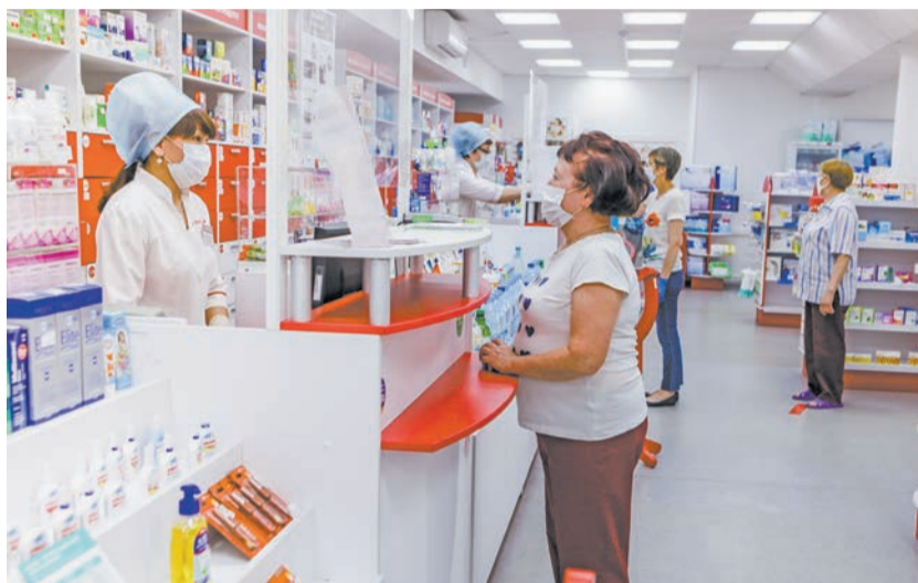
Опытные сотрудники консультируют посетителей «Госаптеки».

АПТЕЧНЫХ ОРГАНИЗАЦИЙ ПОД БРЕНДОМ «ГОСАПТЕКА» РАБОТАЮТ В БАШКИРИИ